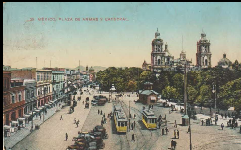
Sta. María Vilata, Pl. Pellicer 5. Valencia, España.