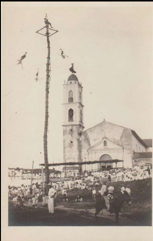
Danza indígena de los Voladores. Papantla, Ver.