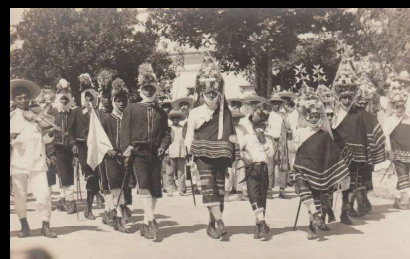
Papantla, Ver. Costumbres Típicas. Danza de los Moros y Cristianos.