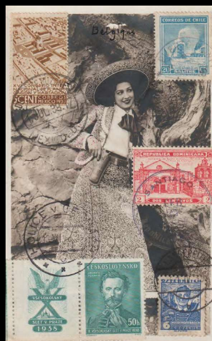
Tarjeta Postal Viajera: México (1/VII/1938), Chile (15/VIII/1938), Checoeslovaquia (12/XII/1938), República Dominicana (27/II/1939), y Austria (21/IV/1939).