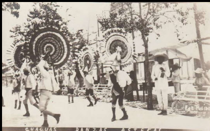
Papantla, Ver. Costumbres populares. Danza de los Guaguas.