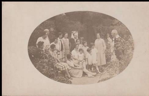
Familia Vilata, Valencia, España.