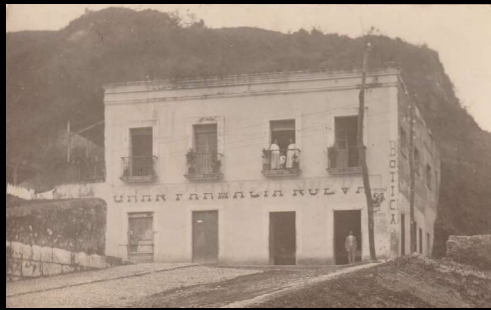
Vista de la casa que ocupa mi botica. En uno de los balcones, Remedios, una de sus hermanas y Julio. En el umbral de la puerta Charles el dependiente. La puerta de la plaquita es la del Consultorio.