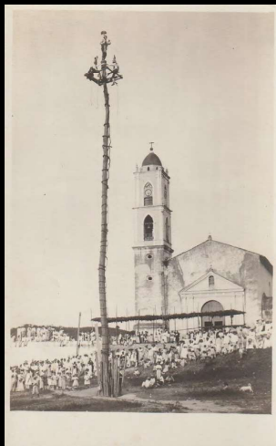
Danza de los voladores. Papantla, Ver.