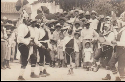
Papantla, Ver. Costumbres populares. Danza de los voladores.