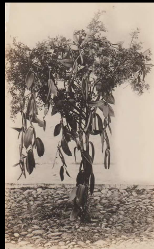
Papantla, Veracruz. Planta de vainilla, bejuco parásito de otros árboles.