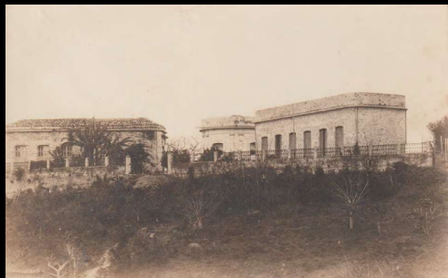
Papantla, Veracruz. Hospital Civil.