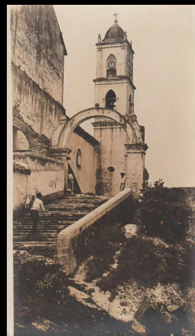
Papantla, Ver. Subida al atrio de la iglesia.