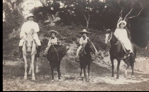
Papantla, Ver. 27 de abril de 1923.

Querido Paco: Sacude un poco la pereza y escíbeme dándome vuestras noticias. Yo no te escribo más a menudo por falta material de tiempo, pues ya ves que no me olvido y de cuando en cuando te envío algunas fotografías, mientras que tú ni eso siquiera. Te envío un abrazo.