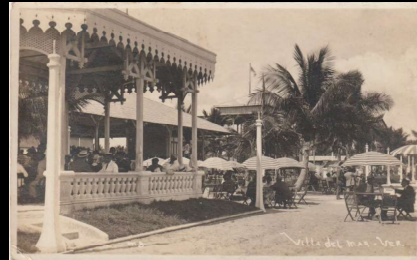
Villa del Mar, Ver.