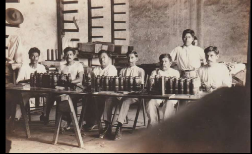
Amarrando la vainilla en mazos, lista para la exportación.