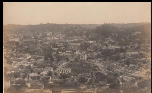
Vista panorámica de Papantla, Ver. Solo lo que corresponde a la parte central de la población, pues se extiende otro tanto a cada uno de los lados.