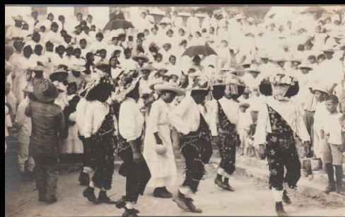
Papantla, Ver. Costumbres populares. Danza de los negritos.