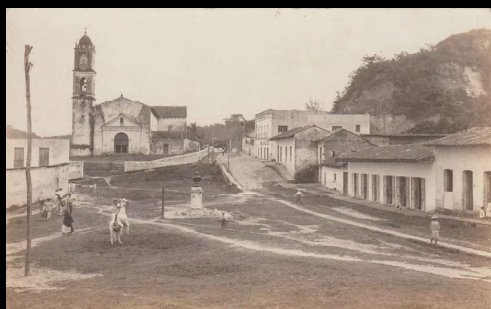
Papantla, Ver. Plaza de Juárez.