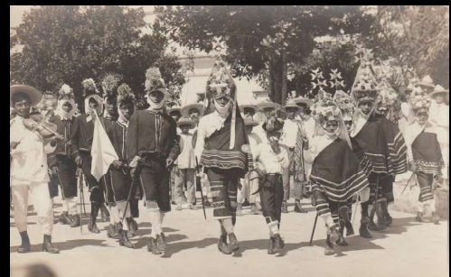
Papantla, Veracruz. Costumbres Típicas. Danza de los Moros y Cristianos.