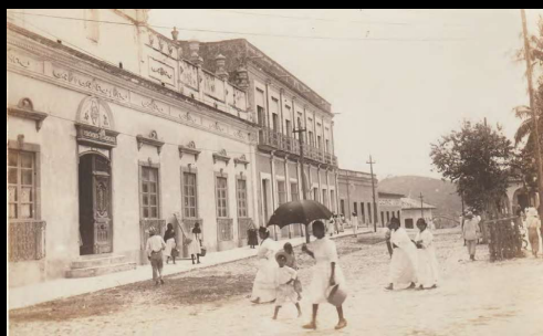
Papantla Plaza Enriquez hoy Madero.