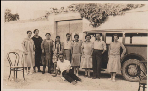
Familia Vilata, Valencia, España.