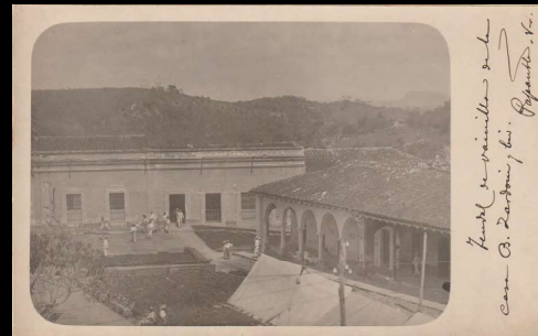
Tendal de vainilla de la casa B. Zardoni y Cia. Papantla, Ver.

Desde el mes de octubre hasta marzo, época del beneficio de la vainilla. Todas las calles y plazas del pueblo están ocupadas (en las horas de sol) por los Tendales de la misma, dejando apenas las banquetas y angostas veredas para los transeúntes. El aroma que se desprende del fruto perfuma el ambiente de la población. Por esto es que a Papantla se le denomina La Ciudad Perfumada.