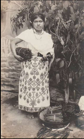
India totonaca recolectando vainilla.