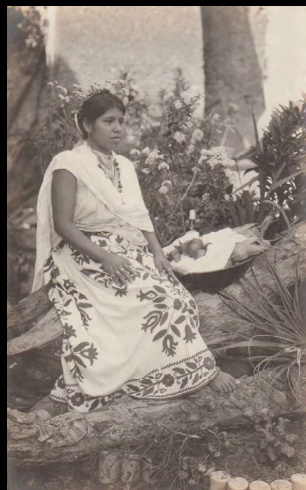
Papantla, Ver. India Totonaca.