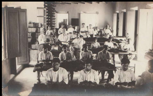
Clasificando la vainilla para amarrar.

Desde el mes de octubre hasta marzo, época del beneficio de la vainilla. Todas las calles y plazas del pueblo están ocupadas (en las horas de sol) por los Tendales de la misma, dejando apenas las banquetas y angostas veredas para los transeúntes. El aroma que se desprende del fruto perfuma el ambiente de la población. Por esto es que a Papantla se le denomina La Ciudad Perfumada.