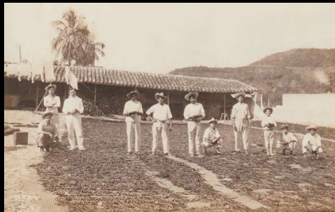
Papantla, Ver. Tendal de Vainilla.