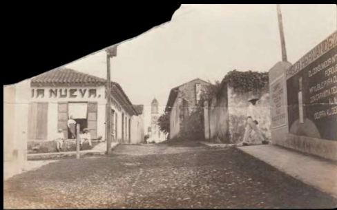
Papantla, Ver. Calle Matamoros y 5 de Mayo.