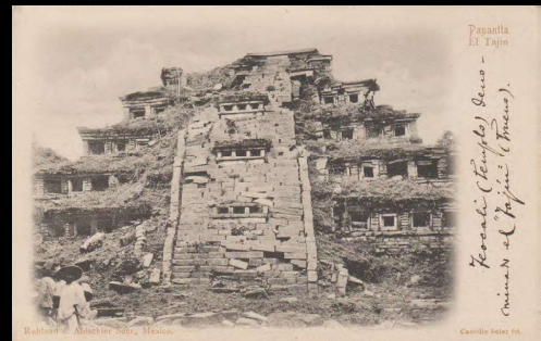
Teocali (templo) denominado el "Tajín" (Trueno).