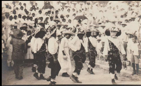
Papantla, Veracruz. Costumbres populares. Danza de los negritos.