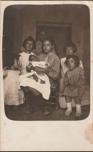
Familia Vilata, Valencia, España.