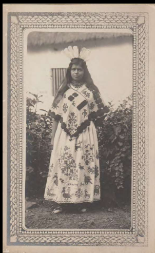
Una indita huasteca con traje de gala.