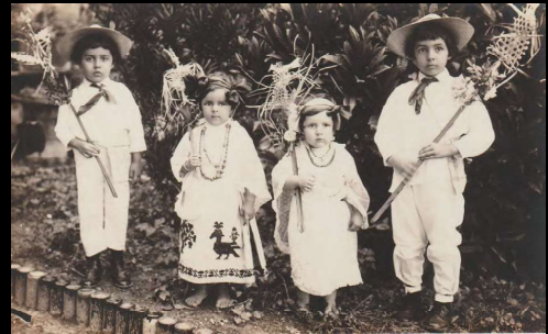
El Martes Santo es costumbre de vestir a los niños de inditos y llevarlos a la iglesia con las palmas que llevaron a bendecir el Domingo de Ramos.