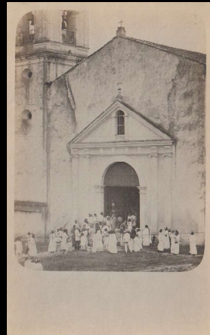
Puerta principal de la iglesia de Papantla. Vista tomada desde uno de los balcones de mi casa (Samuel Morse s/n).