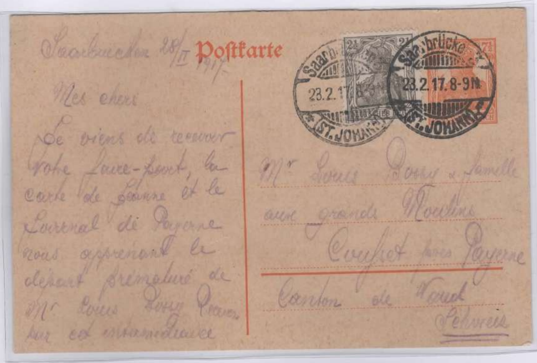
Entero Postal con porte de $7 ½ pfenning + $2 ½ pfenning. Fecha de salida: 28 de Febrero de 1917. Ruta Postal: de Saarbrücken, Saint Johann, Alemania a Cantón de Vaud, Suiza.