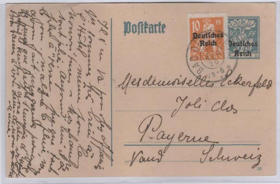
Entero Postal con porte de $30 pfenning + $10 pfenning; con sobrecarga del Imperio Alemán. Fecha de salida: 27 de Septiembre de 1920. Ruta Postal: de Bad Dürkheim, Alemania a Payerne, Suiza.